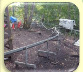
資材や人を運ぶモノレール