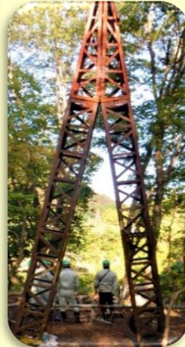
対岸をケーブルでつないで物を運搬。人は吊り橋を渡ります。