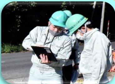
鳴瀬川ダムの完成図を確認