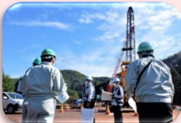
工事用道路の仮橋現場